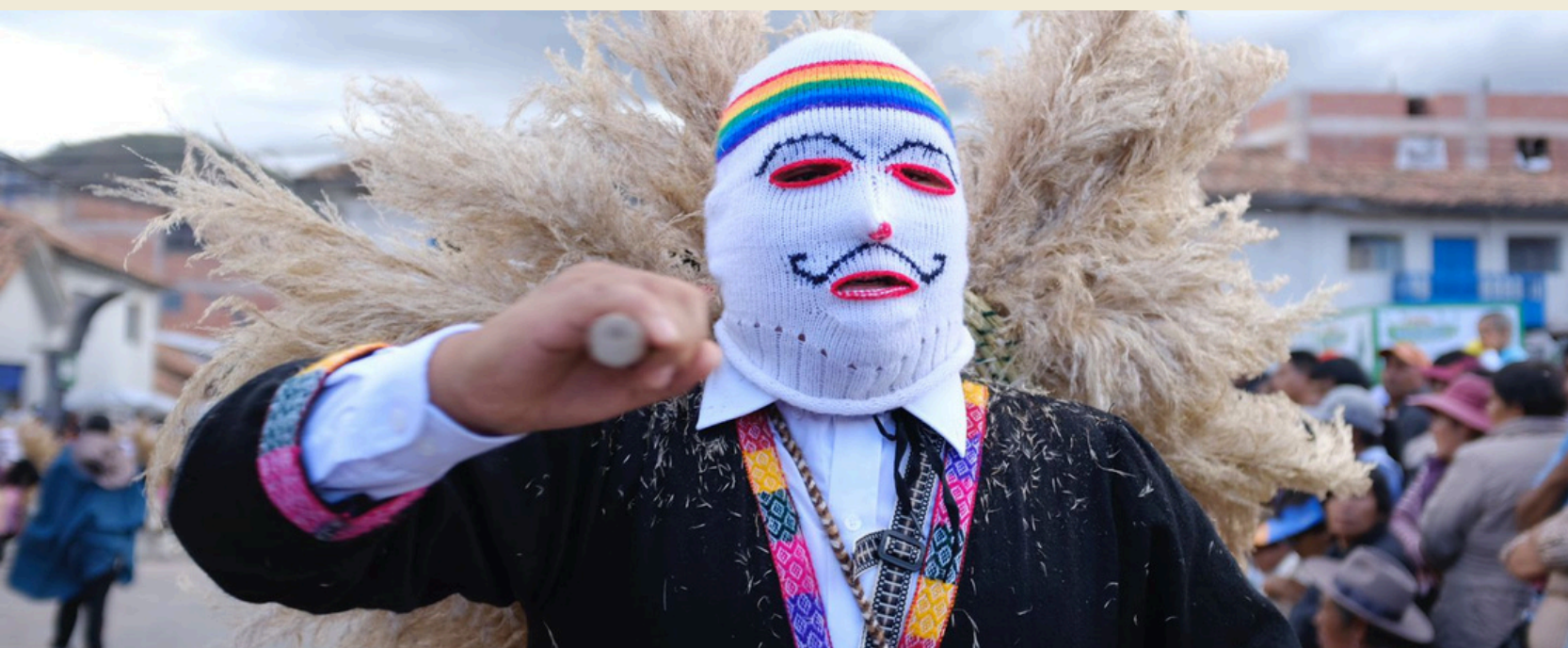
Festividad del Patrón de San Sebastián; Cusco, Perú, Carlos Ayala, 2014